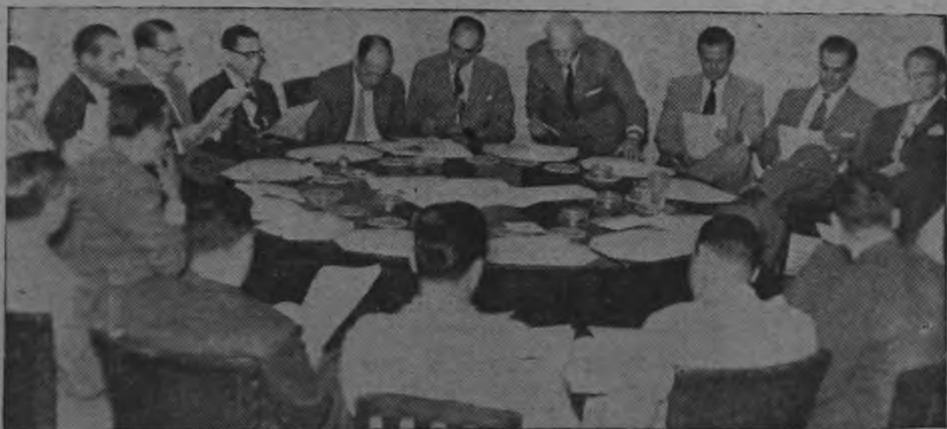
LOS CAFETALEROS SE REUNEN:—Ayer en la tarde se realizó importante reunión en la Oficina del Café. Junto a los directivos del Organismo, en mesa redonda discutieron los problemas y la política cafetalera costarricense, funcionarios de los Ministerios de Hacienda y Agricultura, de STICA y productores nacionales. Secretos? No se permitió la presencia de periodistas y sólo pudimos tomar esta foto y dar la somera información que incluimos hoy en nuestras columnas.