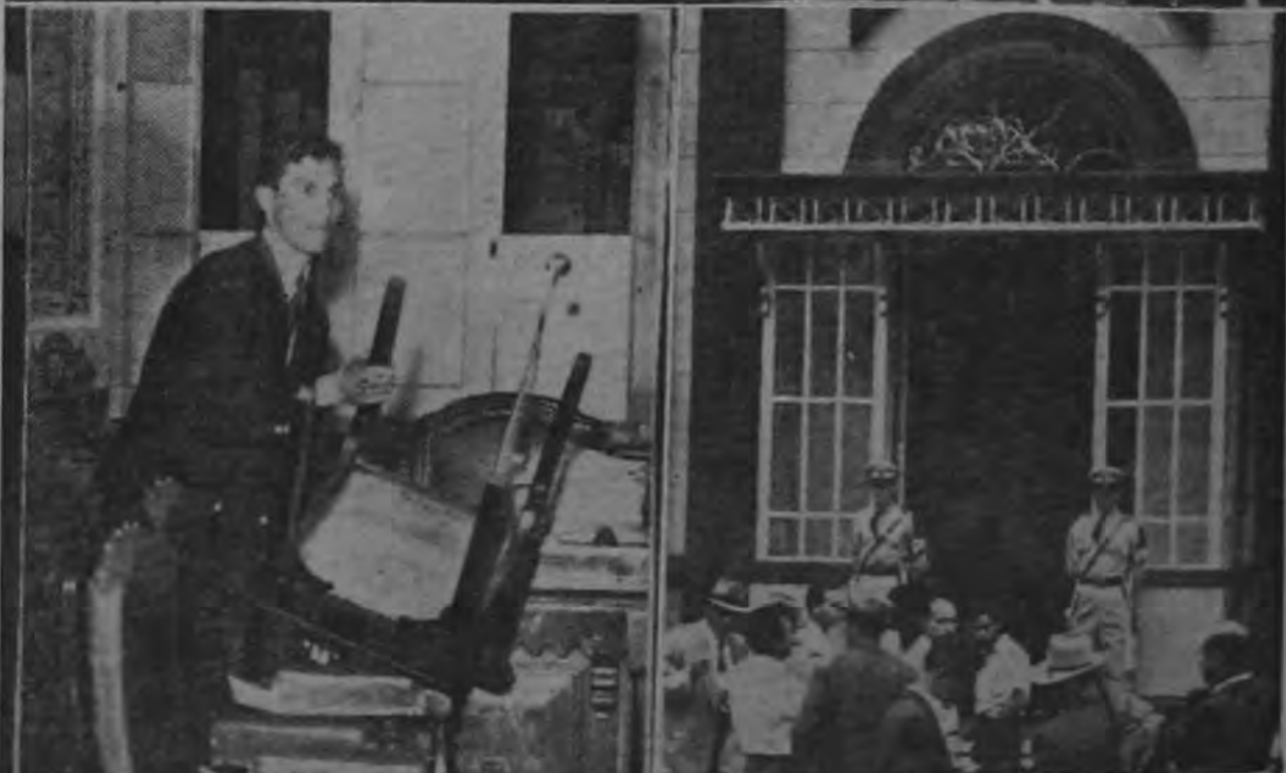
La composición gráfica nos muestra varios aspectos de los desórdenes promovidos ayer en la Asamblea Legislativa por las barras opositoras, las cuales se mantuvieron en una actitud de constante agresividad para con los diputados de la mayoría, impidiendo en esa forma la continuación de la sesión, y la Presidencia hubo de suspenderla para evitar incidentes. En la foto superior se aprecia la confusión reinante en el recinto parlamentario. Abajo, a la izquierda, un ujier de la Asamblea retira una de las sillas que los ocupantes de las barras lanzaron sobre los Diputados, aunque desafortunadamente no ocasionaron ningún daño personal. A la derecha, miembros de la Guardia Civil vigilan la puerta de entrada al recinto en previsión de una irrupción de los saboteadores organizados para agredir al Diputado Bonilla Castro.