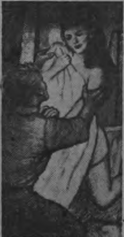
La M-M-M presenta en CINEMASCOPE y METROCOLOR I.

el excelente artista, logra otro triunfo de interpretación humana reviviendo la tumultuosa inquietud del genial pintor a lo largo de una vida llena de furor, de búsqueda, de tremenda inspiración en el espectáculo.