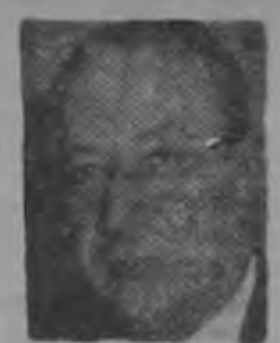
Francisco J. Orlich.